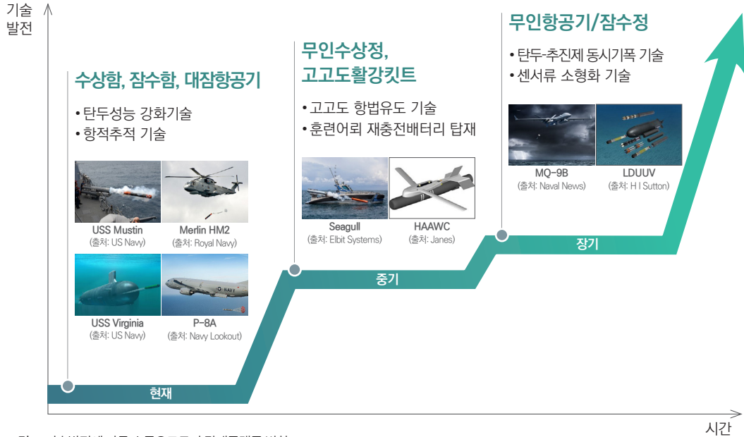
그림4· 기술발전에 따른 수중유도무기 탑재플랫폼 변화