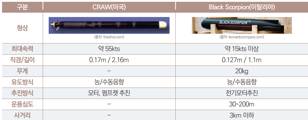
→ 표1·국가별 소형어뢰 현황

노스롭그루먼사는 2016년에 자율운항체계 협동대잠전 탐지-교전훈련 시연을 하며 무인체계 탑재 소형어뢰에 대한 연구를 지속적으로 실시하고 있다. 이 시