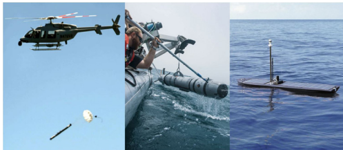
그림1·무인체계 복합운용 시연

연에서는 수중자율탐색체(AUV)가 적을 탐지했을 시 무인수상정(USV)과 음향통신으로 정보를 주고 받고, 무인수상정은 무인항공기(UAV)와 RF통신을 주고 받아서 무인항공기가 공격을 위해 소형어뢰를 투하하는 대잠전을 보여주며, 여러 무인체계가 협업하게 된다면 임무효율성을 향상시킬 수 있다는 것을 보여주었다.