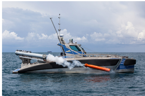
그림3·Elbit System사 USV Seagull의 어뢰 발사시험

레오나르도사는 이스라엘 엘빗시스템사의 무인수상정에 수중유도무기 탑재를 위해 공동 연구개발을 진행한 이력도 있으며, Black Scorpion의 무인항공기 탑재를 위한 연구도 지속적으로 수행하고 있다.